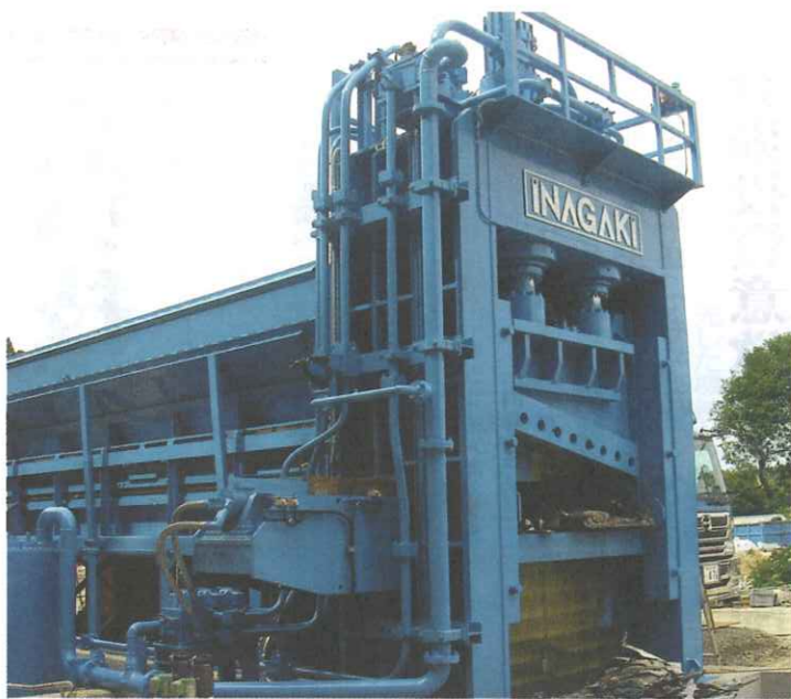
ダブルクランプシャー (SPS650T)