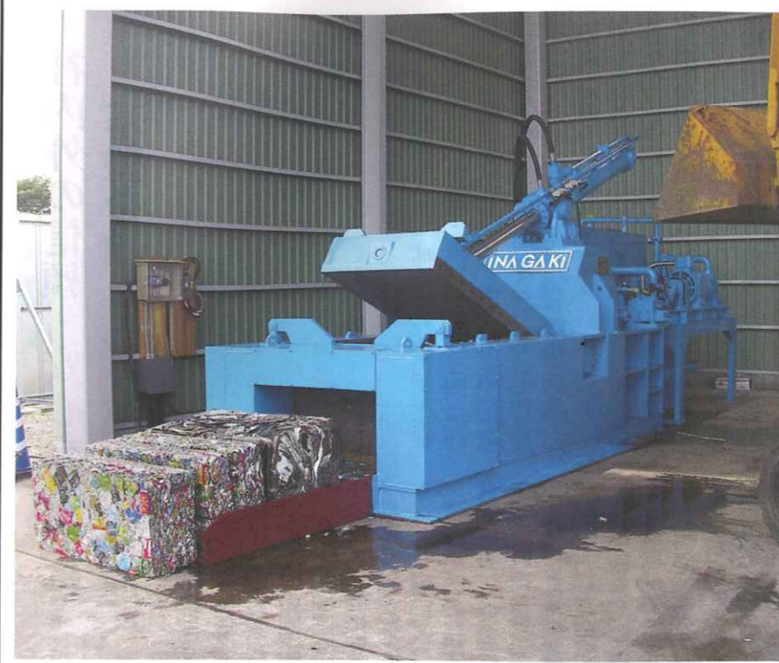
2015年に発売を開始した「インバータエコプレス」

3方縮プレス、販売から50年 改良続けてロングセラーに 稲垣製作所の概要 シリンダーを製作したところから始まりました。現在は3方縮プレス、中型半方縮プレス(SPSシリーズ)、インバータエコシリーズの3機種を 稲垣 稲垣製作所は、今年で設立70年を迎える老舗の機械メーカーです。主力製品の1つ、3方縮プレスは販売開始から50年のロングセラー商品となっている。一方で新技術の導入も進み、一昨年にはインバータ機能を搭載したインバータエコシリーズを発売。確かな製品を提供すると同時にサービス体制の構築にも注力している。稲垣社長に話を聞いた。